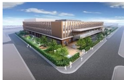
学校規模の適正化を図り、 良好な教育環境の整備を実施 (新設大和田地区小学校完成予定図)