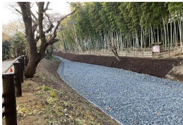
国指定史跡見沼通船堀西縁