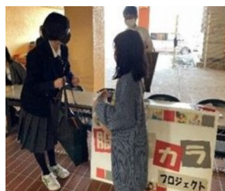
「学校教育におけるSDGsの取組の推進 ～大宮八幡中 服のチカラプロジェクト～