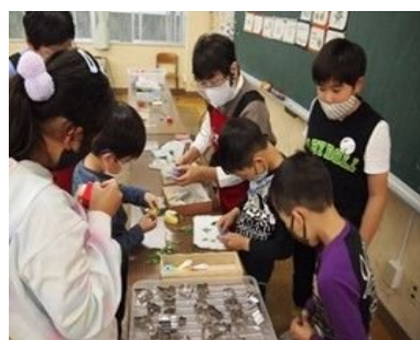
チャレンジスクールで活動する 子どもたちの様子