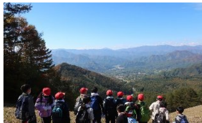
館岩少年自然の家での自然体験活動 高倉山登山（自然の教室・夏季活動プログラム）