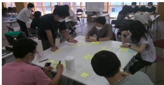
「学びの探究化」を実現できる教員を育成する 次世代教育イノベーター育成研修を実施

また、教職員の働き方の見直しや、地域人材を活用して、生徒にとって望ましい部活動環境を構築するなど、持続可能な教育環境をつくることも重要です。