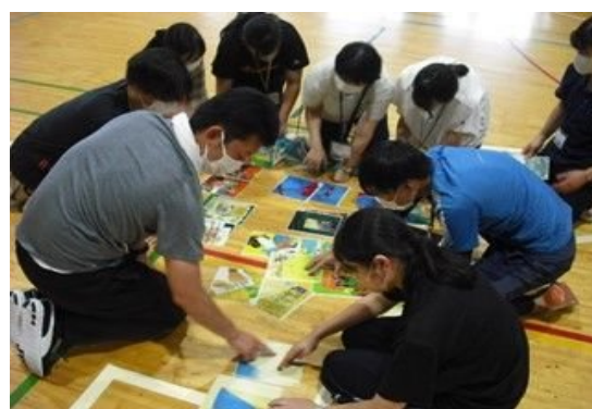
他者と協働することの意義に気づき、 同僚性を高めることを目的とした 初任者研修宿泊研修を実施