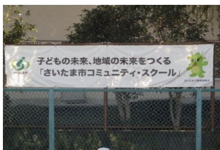
市立全校に掲出されている 横断幕

そのために、学校と地域が連携・協働して未来を担う子どもたちをはぐくむコミュニティ・スクールの一層の充実を図ることが重要です。また、子どもたちの他者との関わりを多様な活動を通じ充実させ、子どもたちが主役となる教育活動を実践していくことで、地域の一員としての当事者意識をはぐくんでいくことも重要です。