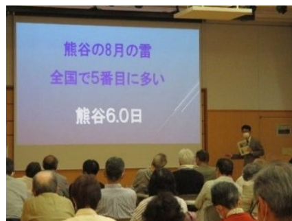
さいたま市民大学「教養コース」