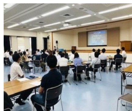
学校管理研修講座において、管理職の マネジメント力向上を図る研修を実施