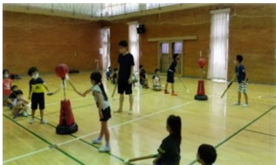
夏休み子ども公民館「スポーツチャンバラ」

そのためには、「いつでも、どこでも、何度でも」学べる環境と、人々が生きがいを持って社会に参画し、地域コミュニティの維持・活性化へ貢献できる仕組みを整えていくことが重要です。生涯学習関連施設で実施する対面の講座を一層充実させていくとともに、知識の習得のみならず仲間と交流する機会の獲得等新たな時代に即した学びを可能とする施設の実現に向けて取り組んでまいります。